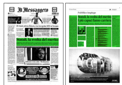
Superficie 50 %

Due profili che oggi vengono selezionati con lo stesso concorso e solo dopo l'assunzione vengono assegnati all'una o all'altra funzione, senza che sia stato misurato chi è più adatto a fare l'uno o l'altro mestiere. Tutto questo cambierà. L'intenzione è di passare dai «profili professionali» ai «profili di competenza». Che significa? Superare in qualche modo il «mansionismo», l'attribuzione di compiti piatti e standardizzati che diventano altrettanti limiti all'azione dei singoli. «Le competenze», spiegano invece le linee guida, «non si esauriscono nelle conoscenze acquisite o maturate nel tempo, ma consistono