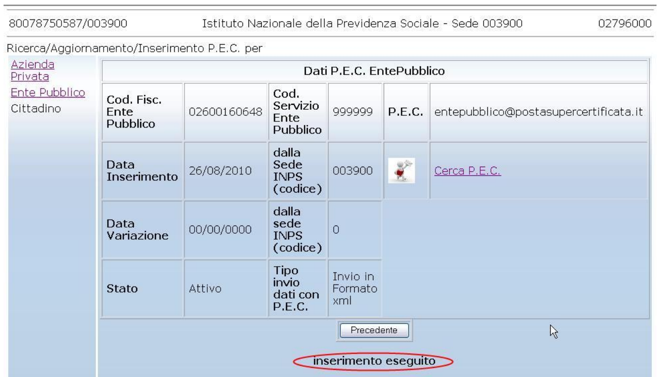
Figura 16. Risposta a inserimento effettuato

Se l'indirizzo è valido l'applicazione restituirà un messaggio di conferma come alla successiva figura 16: