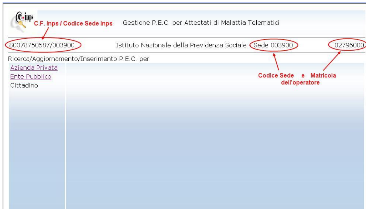
Figura 2. Pannello principale

Il pannello iniziale mostra in intestazione, da sinistra a destra: il codice fiscale dell'Inps, il codice sede e la matricola dell'operatore che ha effettuato l'accesso.