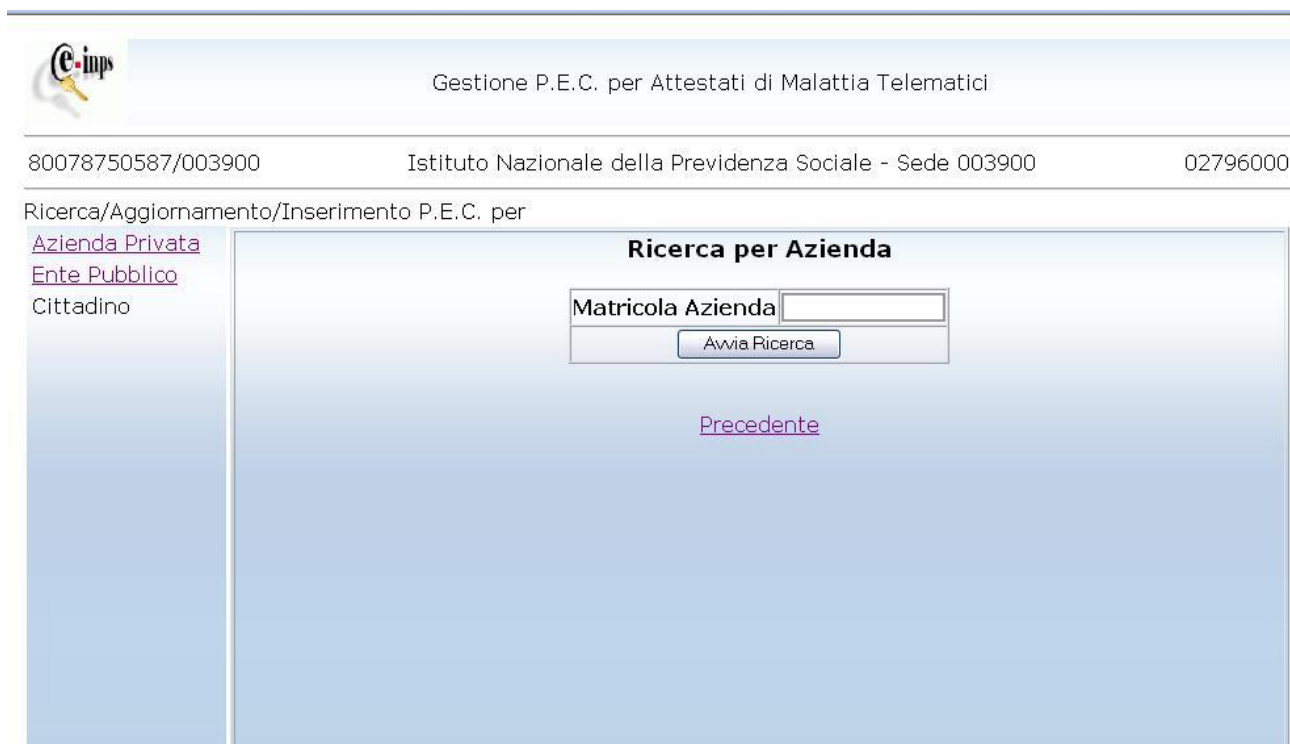
Figura 3. Ricerca per Azienda

‘Cliccando’ sulla voce Azienda Privata si accede al seguente pannello. Nell’apposito campo si scrive la matricola dell’azienda e si invia ‘cliccando’ sul tasto Avvia Ricerca