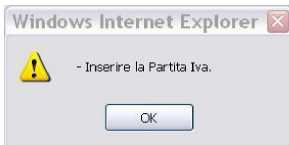
Figura 13. Avviso per Invio con campo C.F. Ente vuoto

Nel caso si dia invio senza inserire il codice fiscale, l'applicazione restituisce un avviso: