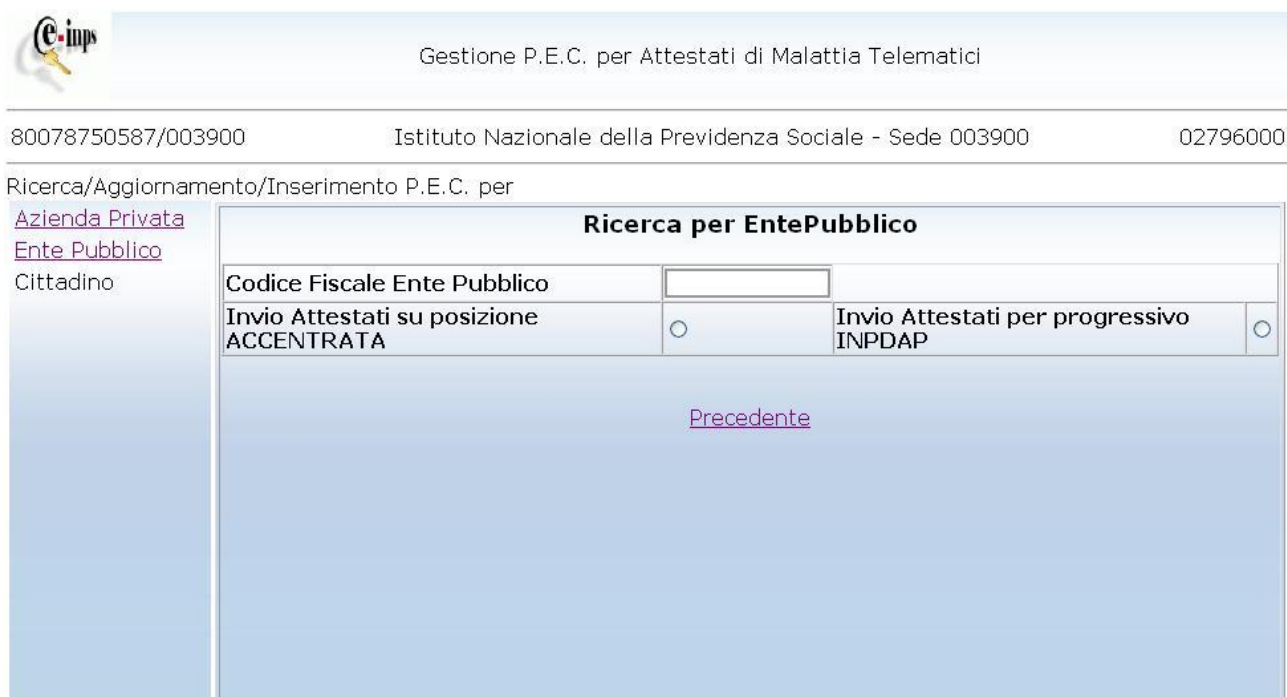
Figura 12. Ricerca per Ente Pubblico

‘Cliccando’ sulla voce Ente Pubblico si accede al seguente pannello.