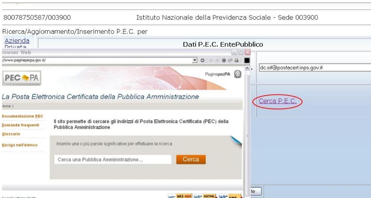
Figura 23. Link al sito P.E.C della P.A.

Cliccando su Cerca P.E.C. il sito si apre in una nuova finestra